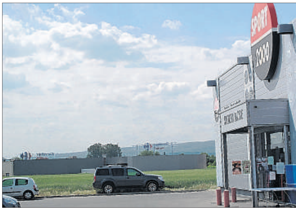
L'extension permettra de relier les deux pôles de la zone commerciale, actuellement séparés par des champs.

Plus surprenant : le promoteur étudierait l'arrivée d'une deuxième grande surface alimentaire sur la même zone que Carrefour Market. Eurinvim serait en négociation avec