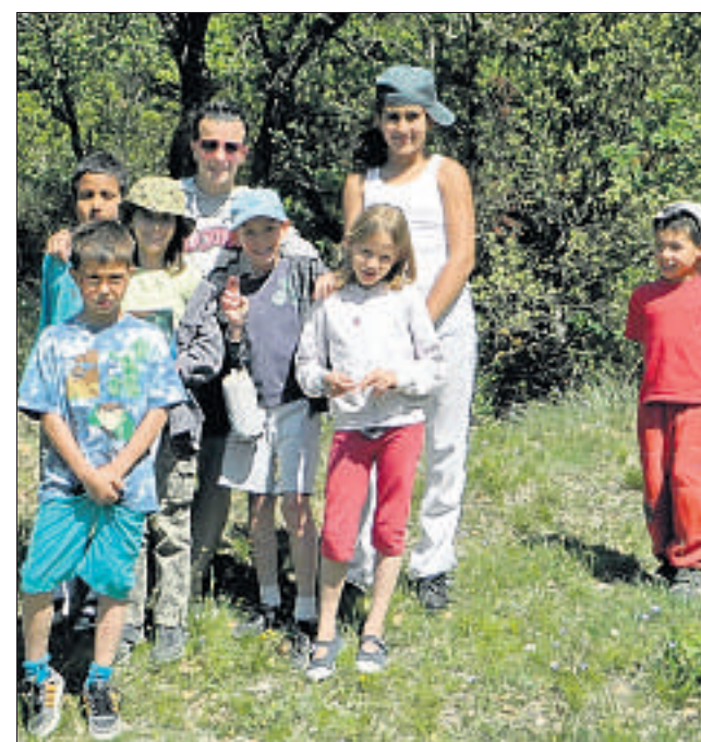
Un rallye photo a ponctué la rencontre inter-centre mercredi après-midi.

Sans oublier les activités théâtre, la parodie de la télévision, les travaux manuels, les jeux et les sorties, au minigolf entre autres. Tout comme les enfants, les animateurs ont été très occupés mais ils ont tous gardé le sourire et se sont bien amusés. Il leur reste maintenant à attendre les grandes vacances pour se retrouver dans cette structure où il se passe toujours quelque chose et où les enfants sont loin de s'ennuyer. □