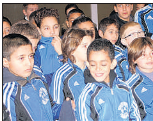
Les pelouses du complexe Gustave-Jaume devraient accueillir plusieurs centaines d'enfants samedi et dimanche.

Dimanche à partir de 8h30, tournoi des U13 avec 12 équipes environ : Tricastin, Chusclan/Laudun/L'Ardoise, Baume/Montségur, Centre Ardèche, Donzère, Vallée du Jabron, Viviers, St Alexandre ainsi que trois équipes de Pierrelatte.